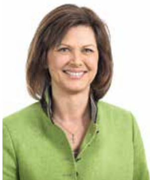
Ilse Aigner, MdL Präsidentin des Bayerischen Landtags